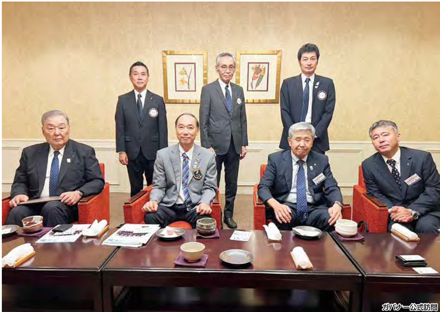
ガバナー公式訪問