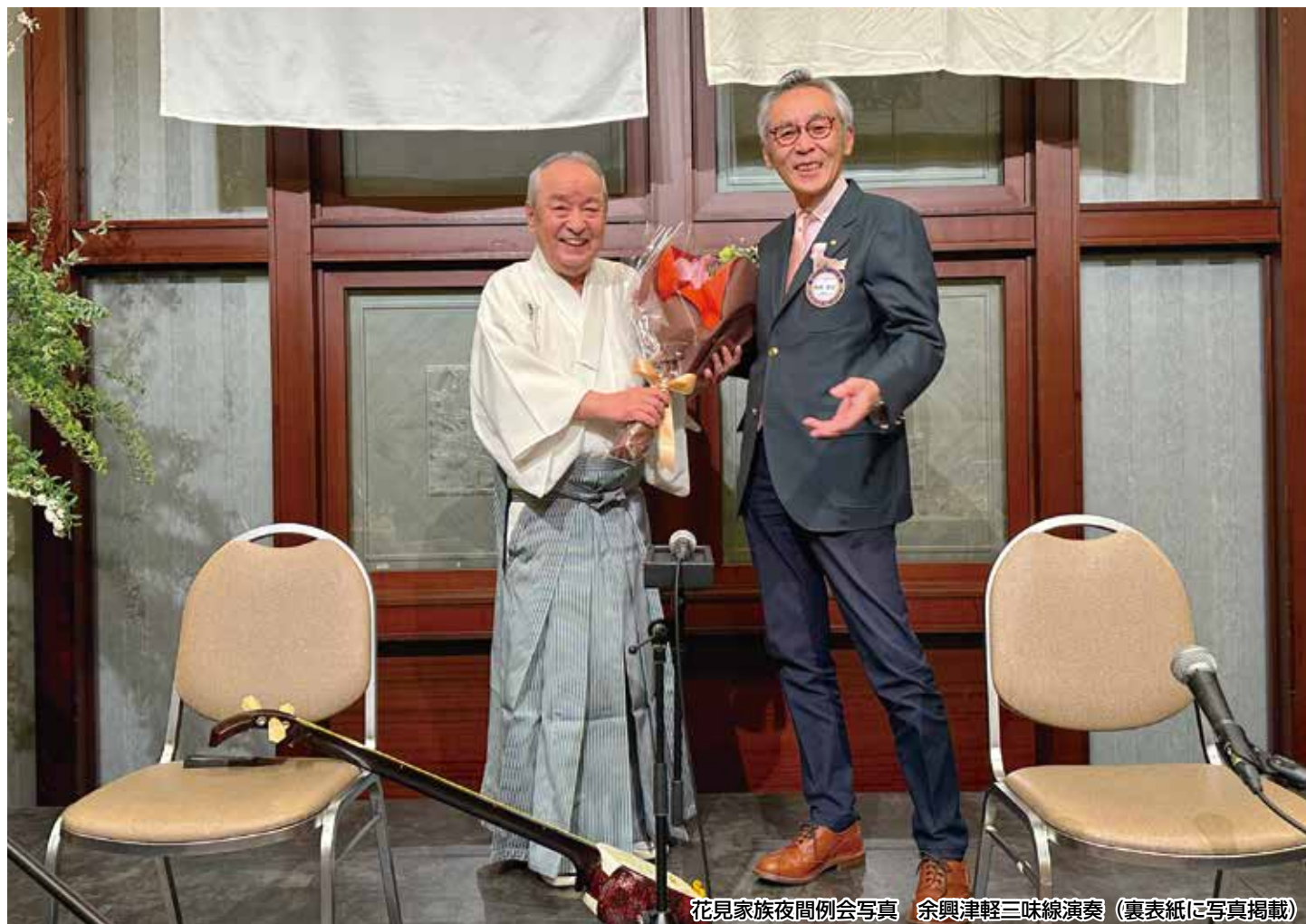
花見家族夜間例会写真 余興津軽三味線演奏 (裏表紙に写真掲載)