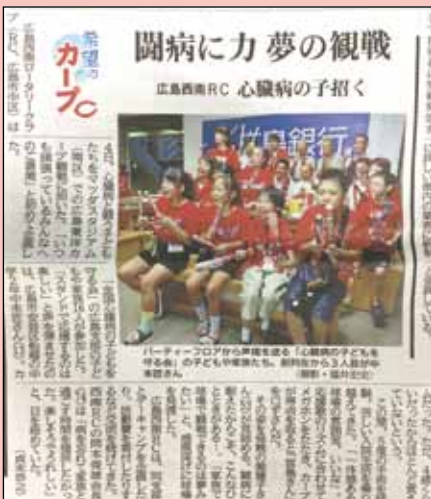
中国新聞9月5日掲載