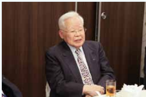
30周年記念誌の座談会にて(2016年6月28日)